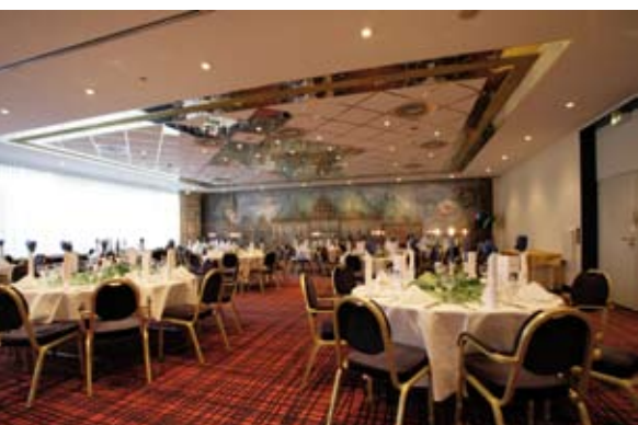
Der große Festsaal bietet eine stimmungsvolle Wandmalerei von ‚Bremens Guter Stube‘.