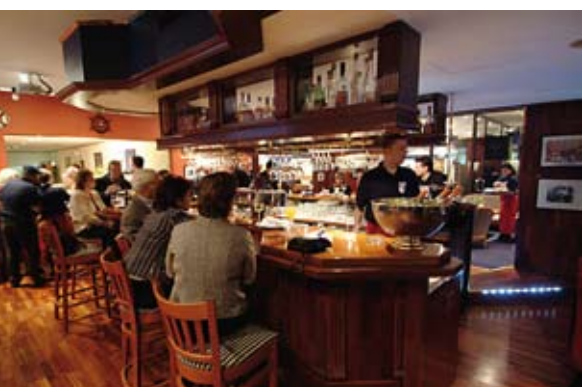
An der einladenden Hotelbar nimmt man gerne Platz.