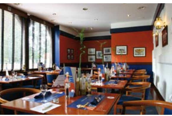
Im maritimen Red'n Blue Restaurant'n Bar fühlt man sich fast wie auf einem Kreuzfahrtschiff.