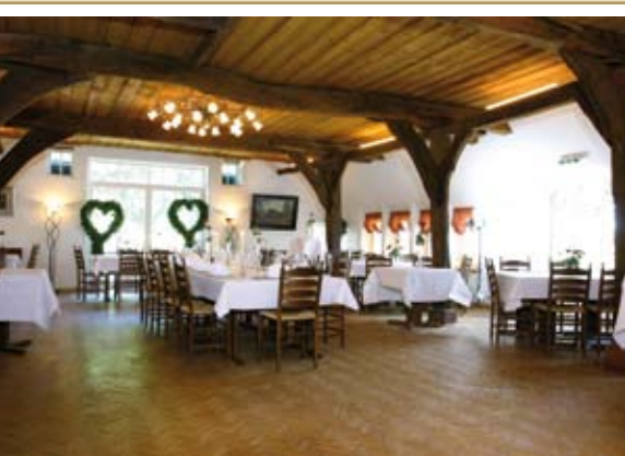
Schöner Saal mit Holzgebälk.