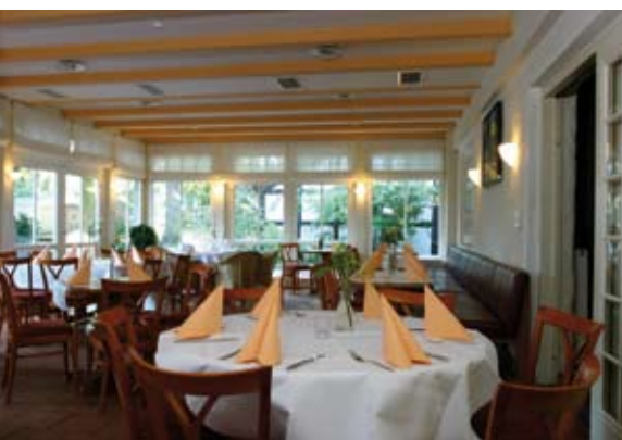
Wintergarten mit Blick ins Grün.