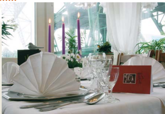
Für Technikfreunde ein Genuss: der Ausblick auf die historische Schwebefähre.