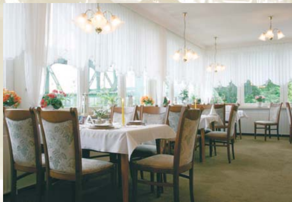
Mit viel Charme feiert man im Fährkrug.