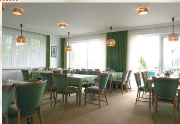
Gemütlich feiern und den Blick auf die Oste genießen kann man im Fährkrug ausgiebig.